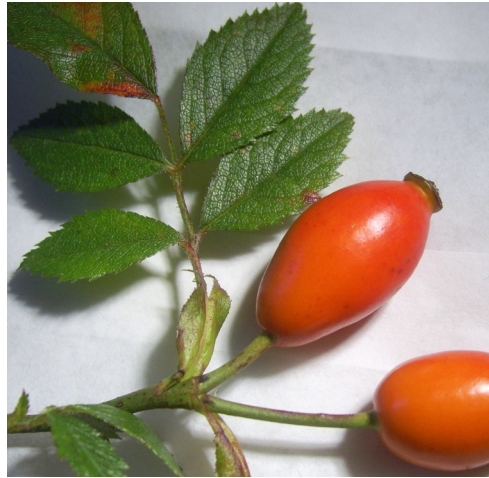
elliptica, inodora, agrestis

Abb. 4.: Fiederblättchen am Stielansatz keilig, spitzwinklig zulaufend.