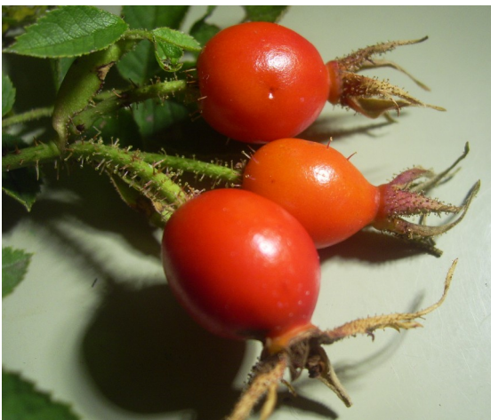
Abb. 3.: Abstehende Kelchblättern auf reifen Hagebutten. (und Drüsen an den Hagebuttenstielen)

rubiginosa, elliptica, inodora, dumalis, subcanina, majalis, spinosissima, caesia, subcollina, glauca, pendulina, sherardii, villosa