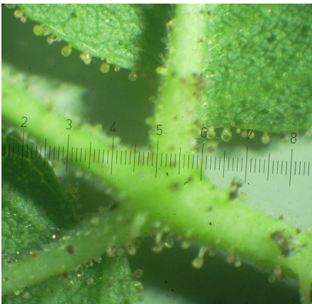
Abb. 2: Drüsen an den Blattfiedern und der Mittelrippe

Es können auch die Stiele der Hagebutten und die Hagebutten selber Drüsen aufweisen. Etwas schwieriger zu erkennen ist es, ob nur zwischen den Zähnen am Blattrand viele Drüsen stehen.